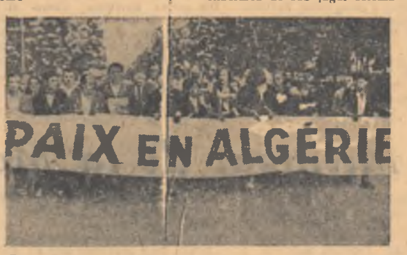
Tineri muncitori și studenți din Paris manifestează purtînd lozincă: „PACE IN ALGERIA”