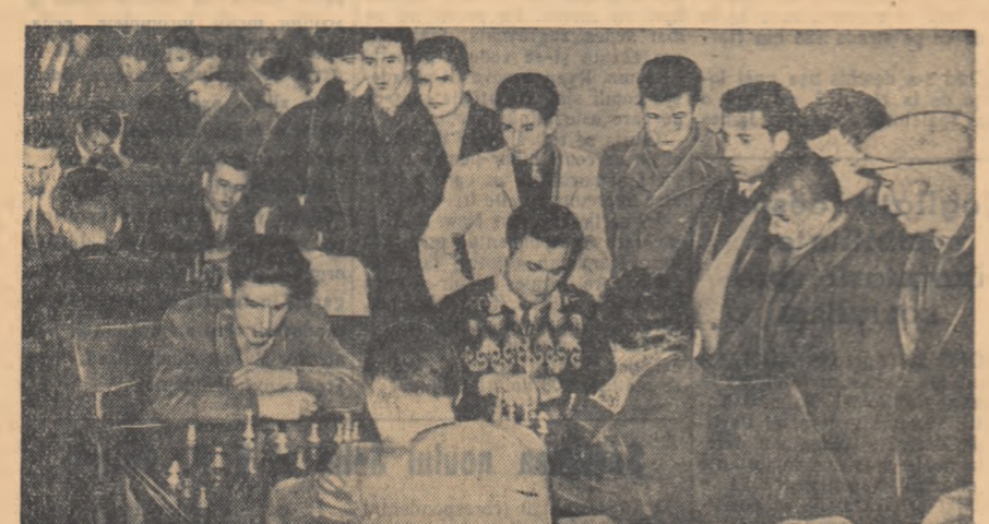
În fotografie: un aspect din timpul întrecerilor.

Stăteam într-un colț al sălii și priveam forțoasă neobisnuit din jurul meselor de șah. Mulți, foarte mulți participanți la faza raională a Spartachiadei.