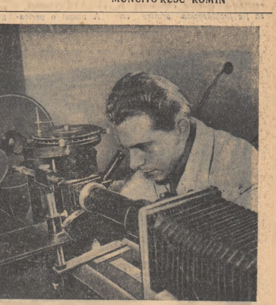
La Institutul de cercetare a metalelor de pe lângă Academia R.P.R., colectivul de ingineri și tehnicieni execută cele mai complicate analize fizice și chimice asupra metalelor.

Comitetul Central al Partidului Muncitoresc Român trimite celui de al IX-lea Congres al Partidului Comunist din Norvegia un salut fratresc și urează întregului partid succes deplin în lupta pentru unitatea clasei muncitoare, pentru interesele vitale ale oamenilor muncii din Norvegia, pentru pace, democrație și socialism. COMITETUL CENTRAL AL PARTIDULUI MUNCITORESC ROMÂN