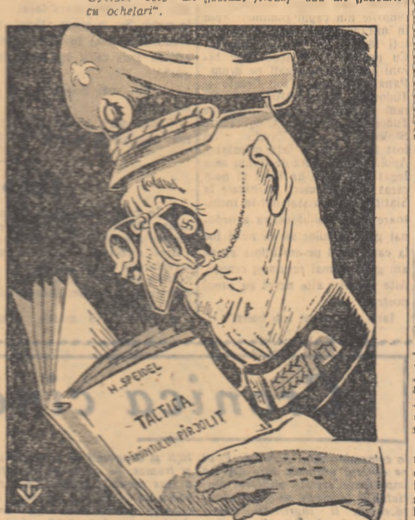
Ochelar și filozofia „savantului” Deser de V. TMOC

CAIRO 13 (Agerpres). — Ziarul „Al-Gumburia” scrie că după ce Egiptul a declarat că este hotărât să nu accepte un guvernator administrativ pentru sectorul Gaza și să instituie în acest sector control administrativ, forțele armate speciale ale O.N.U. au început să se instaleze în zona sectorului Gaza de peninsula Sinai. Ziarul arată că trupele O.N.U. îngrădesc cu sîrmă ghimpată căile de acces din sudul sectorului Gaza și se pregătesc chiar să minereze această regiune. După cum relatează zărilor, grupele suedeze staționate la Rafa împiedică liberul acces al locuitorilor în și din sectorul Gaza.