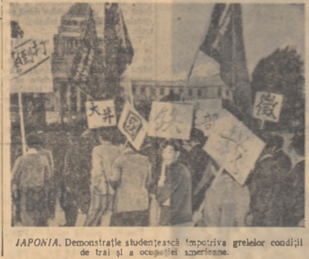
JAPONIA. Demonstrație studențească împotriva greilor condițiilor de trai și a ocupației americane.