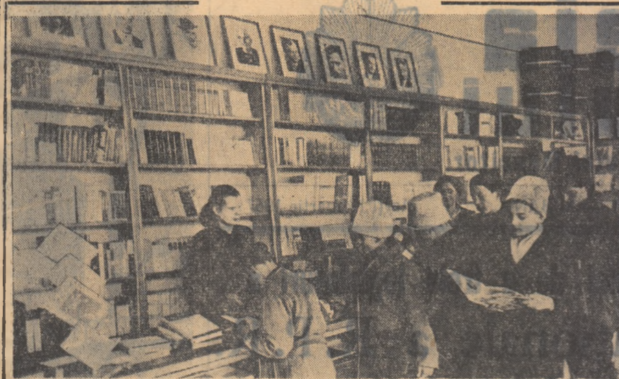
Încă o librărie în orașul Gherla regiunea Cluj, motiv de bucurii pentru tinerii din localitate.