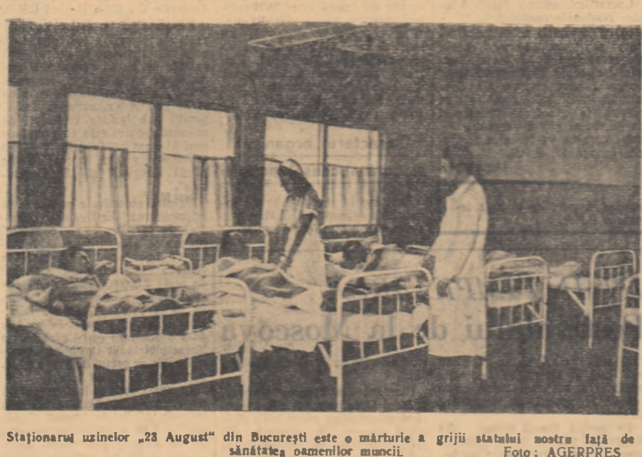
Staționara uzinelor „23 August” din București este o mărturie a grijii statului nostru față de sănătatea oamenilor muncii.

— Poți aștepta oare să-și petreacă recreația în clasă? — Nu, dar de unde? — Se miră el zîmbitor. — Poți să-și petreacă recreația în clasă? — Nu, dar de unde? — Se miră el zîmbitor.