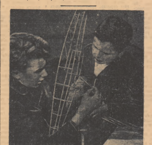
Atenția și pasiunea cu care lucrează cei doi membri ai cercului de aeronautică de pe lângă uzina Libeca (R. Cehoslovacia) se îndreptălează să creeze o mașină, și se vor număra printre cei mai entuziaști constructori de avioane, printre cei mai destoinici stăpîni ai aerului. In Cehoslovacia, ca in oricare altă țară trăiesc de democrație populară, copiii au cele mai largi posibilități pentru dezvoltarea aptitudinilor și talentelor lor.

momentul in care acești cetățeni părăseau clădirea misiunii. Aceste acțiuni ale autorităților americane, se spune in notă, constituie un amestec in activitatea diplomatică și consulară a misiunii și nu contribuie nici decum la dezvoltarea unor relații normale între cele două state. Misiunea ungară cere cu hotărîre autorităților S.U.A. să pună capăt acestei activități incompatibile cu principiile dreptului international și ale practicii diplomatice.