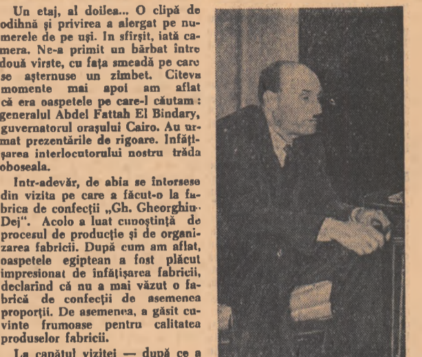
Un etaj, al doilea... O clipă de odihnă și privirea a sîrgerat pe numerele de pe uși. În sfîrșit, iată camera. Ne-a primit un bărbat întredouă vîrste, cu fața smecată pe care se asterusea un zîmbet. Cîteva momente mai apoi am aflat că era oaspele pe care-l căutam: generalul Abdel Fattah El Bîndary, guvernatorul orașului Cairo. Au urmat prezentațiile de rigoare. Înfașurarea interloctorului nostru trăda oboseala.

Intr-adevăr, de abia se întorsese din vizita pe care a făcut-o la fabrica de confecții „Gh. Gheorghiu-Dej”. Acolo a luat cunoștință de procesul de producție și de organizarea fabricii. După cum am aflat, oaspele egiptean a fost plăcut impresionat de înfașurarea fabricii, declarînd că nu a mai văzut o fabrică de confecții de asemenea proporții. De asemenea, a găsit cuvinte frumoase pentru calitatea produselor fabricii.