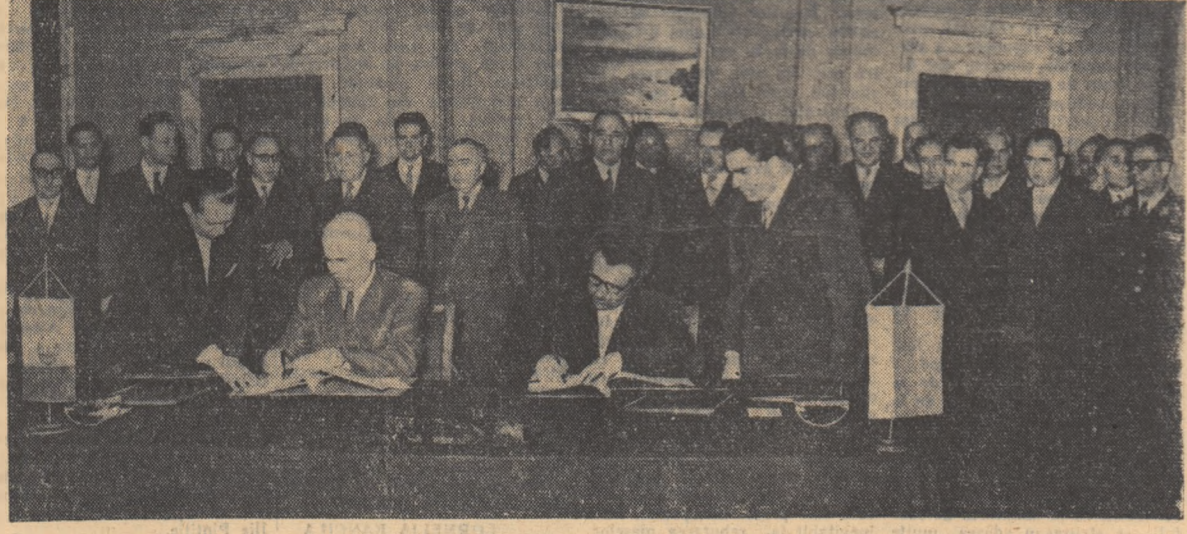
Semnarea Declarației privitoare la tratativele dintre delegațiile guvernamentale ale R.P.R. și R.P. Bulgaria.