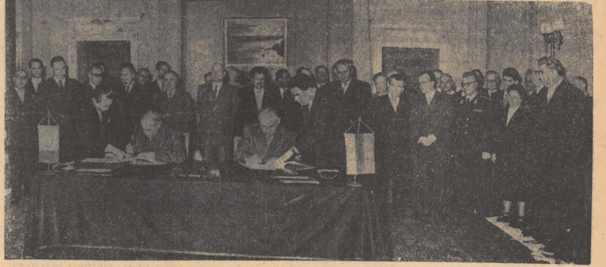
Semnarea Declarației cu privire la tratativele dintre delegațiile Partidului Muncitoresc Român și Partidului Comunist Bulgar.