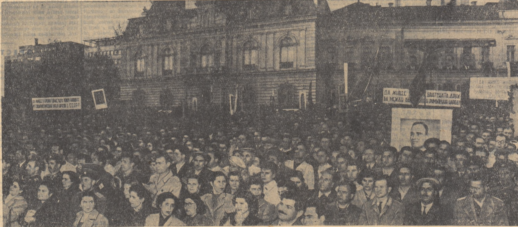
Aspect de la marele miting de la Sofia, consacrat prieteniei dintre poporul român și poporul bulgar

Analizînd felul în care s-au desfășurat pînă în prezent colaborarea între Partidul Muncitoresc Român și Partidul Comunist Bulgar participanții la tratative au constatat cu satisfacție că aceste relații s-au întărit și lărgit încontinuu în folosul ambelor țări. S-a folosit, atunci cînd a fost necesar metoda consultărilor reciproce în problemele de interes comun, s-a dezvoltat în mod simțitor informarea reciprocă asupra principalelor probleme care