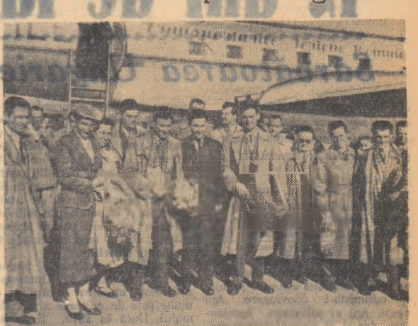
Miercuri la amiază a sosit în Capitală o delegație a Tineretului Popular Iugoslav, condusă de tovarășul Mika Tripalo, secretar al Comitetului Central al T.P.I.

Delegația a venit la invitația C.C. al U.T.M. pentru a face o vizită de două săptămîni în țara noastră ca răspuns la vizita făcută de delegația C.C. al U.T.M. în noiembrie 1956 în R.P.F. Iugoslavia.