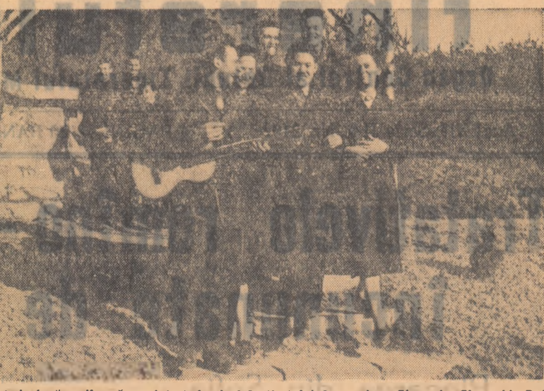
Îi cunoașteți după uniformă: sînt studenții ai Institutului de mine „Gheorghe Gheorghiu-Dej” din Petroșani. După orele de curs au pornit la plimbare prin cele mai frumoase locuri ale orașului.

Trebuie încercat să se schimbe vechiul sistem de pregătire a