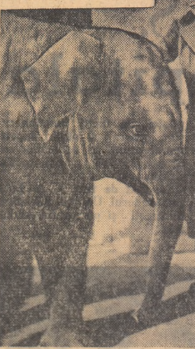
O scenă din filmul „Bonjour elefant”