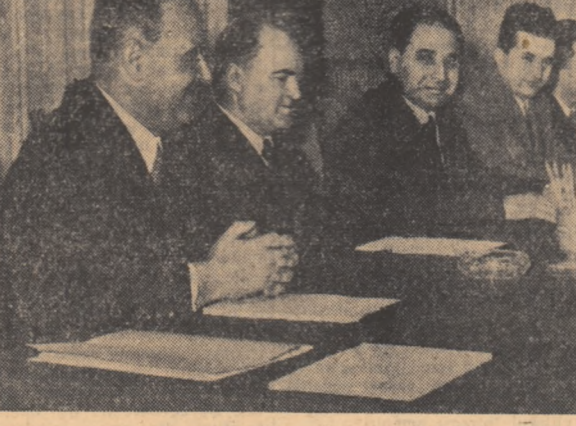
La masa unde au loc convorbirile între delegația Partidului Muncitoresc Român și delegația Partidului Comunist Francez