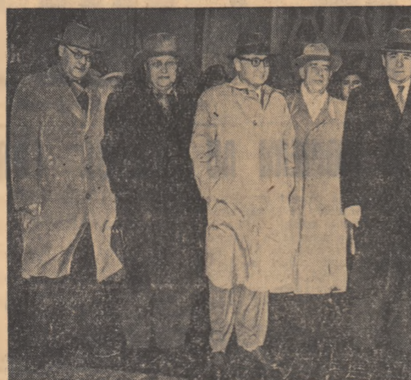
La aeroport înainte de plecarea avionului

Citiți în pag. III-a: ACORDUL ÎNTRU GUVERNUL R.P.R. ȘI GUVERNUL U.R.S.S. REFERITOR LA STATUTUL JURIDIC AL TRUPELOR SOVIETICE STAȚIONATE TEMPORAR PE TERITORIUL R.P.R.