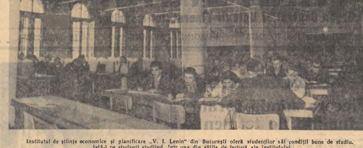
Institutul de științe economice și planificare „V. I. Lenin” din București oferă studenților săi condiții bune de studiu. Iată-l pe studenții studînd într-una din sălile de lectură ale institutului.

Duminică — 21 IV. 1957 ora 19.30 — Formații studențești pe scena Casei de cultură a studenților. „I.S.E.P.” prezintă: „GOGU ȘI RICA STUDENȚII”, spectacol satiric muzical.