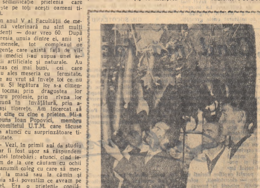
Nu este o fotografie rămasă din vara trecută. E o imagine actuală, făcută acum cîteva zile, dar nu în grădina unde cresc deobicei castraveții, ci, în sera Institutului agronomic din Cluj. În această seră, sub îndrumarea asistenților și profesorilor, studenții, își experimentează lucrările lor științifice.