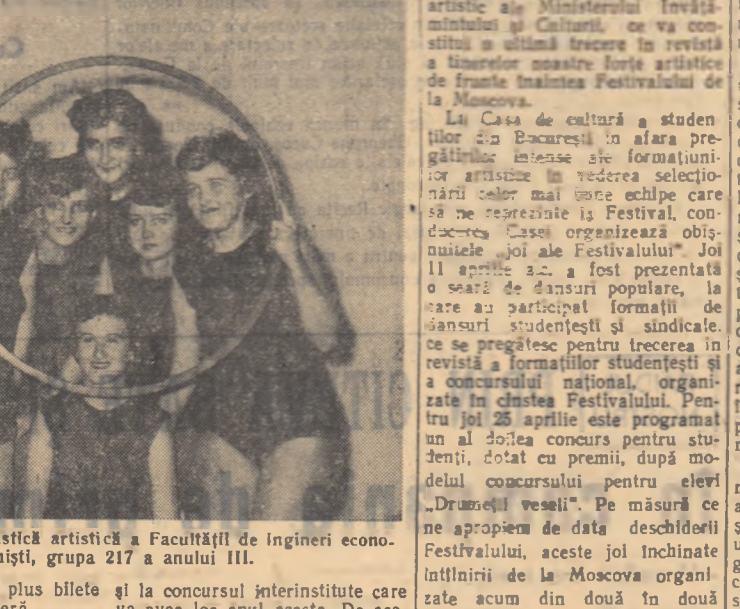
Echipa de gimnastică artistică a Facultății de Ingerii economiști, grupa 217 a anului III.