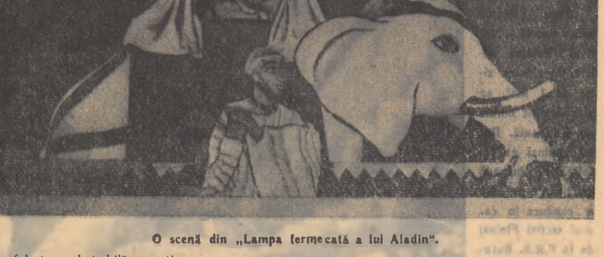
O scenă din „Lampa fermecată a lui Aladin“.