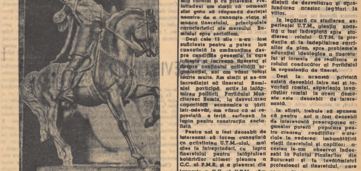
Statuetă de bronz, reprezentînd pe Ștefan cel Mare — executată de C. BARASCHII.

Am încercat din non sentimental în călătorii pe cărările, unorii late, altorii puțin plute, ale istoriei. Multimea de nume și cifre s'istoriei mă obsedează de pe vremea învățăturii. Într-un ungher sau al memoriei sălăluiește o lerie de nume ilustre din treta patriei. Anii domniei, citeva tălbi plus o legendă sau mai lde. Apoi drumurile istoriei se rde în necunoscut pentru mulți ntre cei ce am scolarit cu un centu-două în urmă.