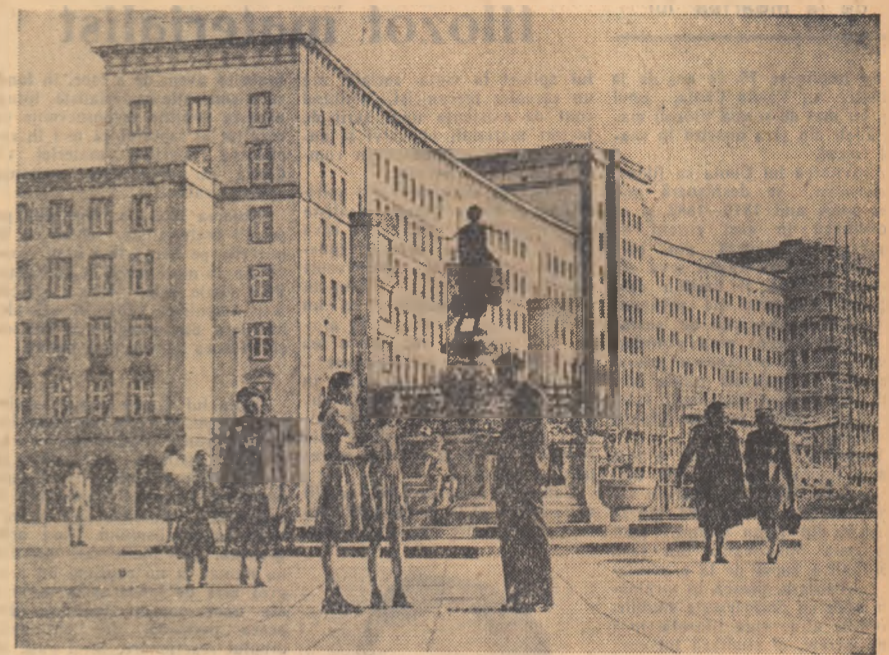
Construcția de locuințe este în plin avînt. Noile case ce se construiesc în piața Ross din orașul Leipzig, sînt pe terminate. În fotografie: primul grup de șase case date în folosință.