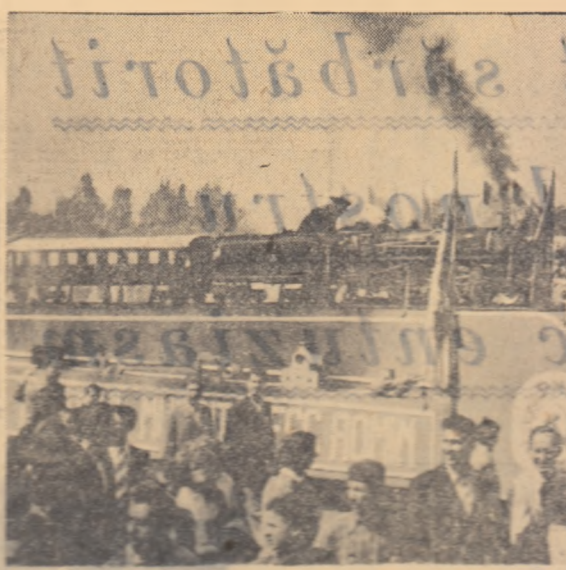
Șelură e locomotivă. În fața tribunei vin ceteriștii.