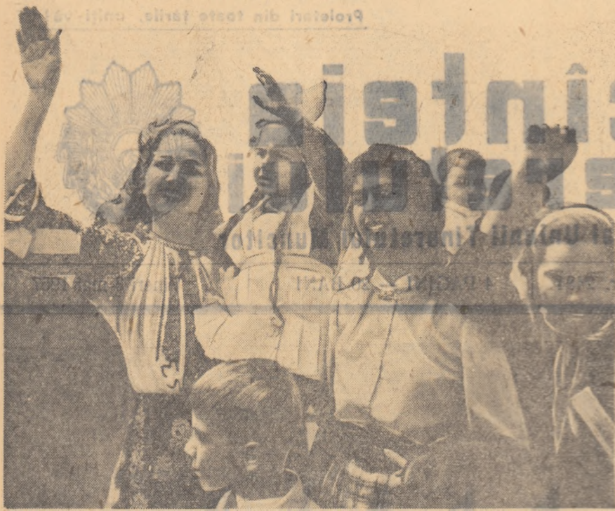
Pe fețele lor citești bucuria.