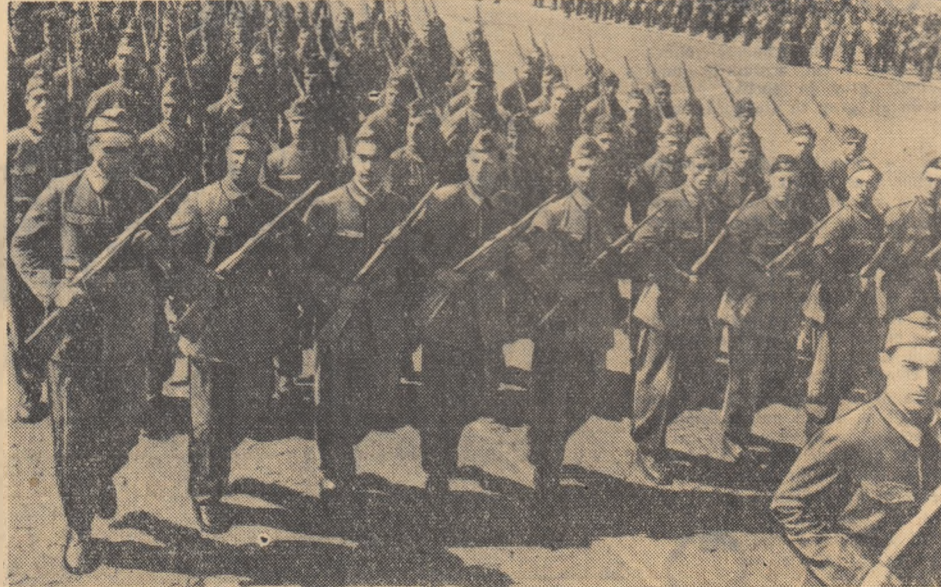
Defilează gările muncitorești

Acum să-i privești fără să fii sincer emoționat. Sentințele, viziile, sănătatea — fiecare în parte și toate la un loc, le cîleşti pe chipul copiilor noștri. În minte de poet s-a gândit să transforme pe micuții demonștrări într-o grădină vie de maci și narcise. În piață pătrund coloanele oamenilor muncii. O locomotivă ghidată în depărtare. Acolo sînt cefele. Fetele de la „Mătasea Populară” au venit cu un stand rotativ ce ne înfățișează cele mai noi și mai reu-