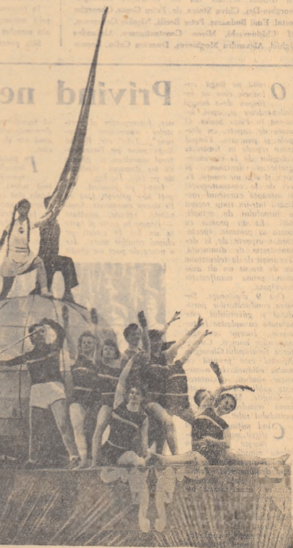
Un car alegoric al sportivilor îndelung aplaudat.