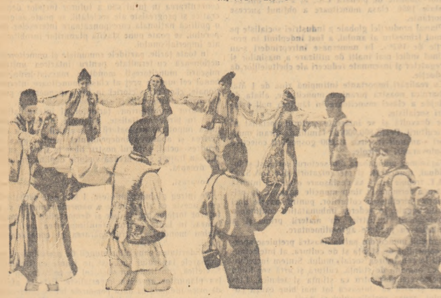
Coloana s-a oprit și s-a încins o horă. Reporterul cinematografic este prezent la datorie.