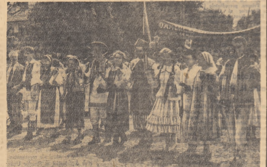
În frumoase costume naționale defilează tineri plini de viație.

Lîngă mine un confrate stătea le vorbă cu M. Poms, administra- tor al spitalului orașencic din Amsterdam. Acesta îi povestea des- pre impresia puternică pe care -au produs-o gîrziile muncitorești