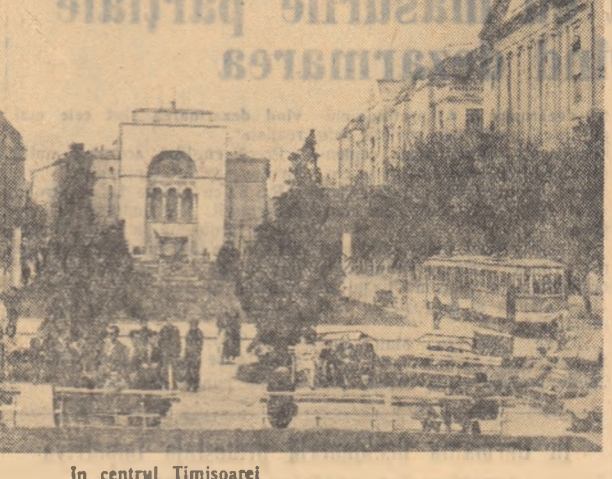
In centrul Timișoarei

— „Vă transmitem din partea clasei muncitoare din Iugoslavia cele mai calde salutații și bune urări...”