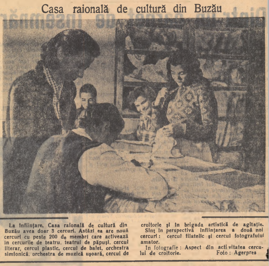
La înființare, Casa raională de cultură din Buzău avea doar 3 cercuri. Astăzi ea are nouă cercuri cu peste 200 de membri care activează în cercurile de teatru, teatru de păpuși, cercul literar, cercul plastic, cercul de balet, orchestra simfonică, orchestra de muzică ușoară, cercul de croitorie și în brigada artistică de agitație. Sînt în perspectivă înființarea a două noi cercuri: cercul filatelic și cercul fotografiei amator.

În fotografie: Aspect din activitatea cercului de croitorie.