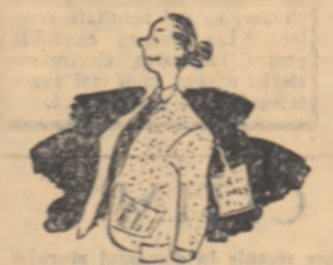
— Cum intră în magazin și dă cu ochii de rafturi, se înlățește. E multumită, la o jachetă. O îmbracă. Îi vine minunat. A îmbrăcat doi leperi cîntorodată: un li și un frig și — va fi elegantă.

— Acum unde mergem? Intrebarea era firescă. — La „DOAMNA NEVAZUTA“.