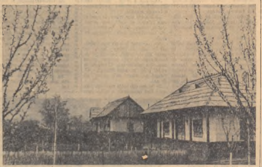
„Strada colectivizilor“ din comuna Roma, raionul Botoșani. Pe această stradă colectivizii din G.A.C. „Ilie Pîntilie“ și-au construit în ultimii ani 80 de case noi.

Marți seara, delegația Scupșei Populare Federative Iugoslavo-Ruse a sosit la Orașul Stalin, venind de la Hunedoara.