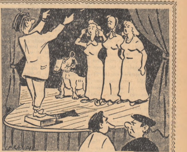
— De ce nu-l dă afară? — E altă de rău? — Nu, e cinele directorului!... desene de MIHAI CARANFIL