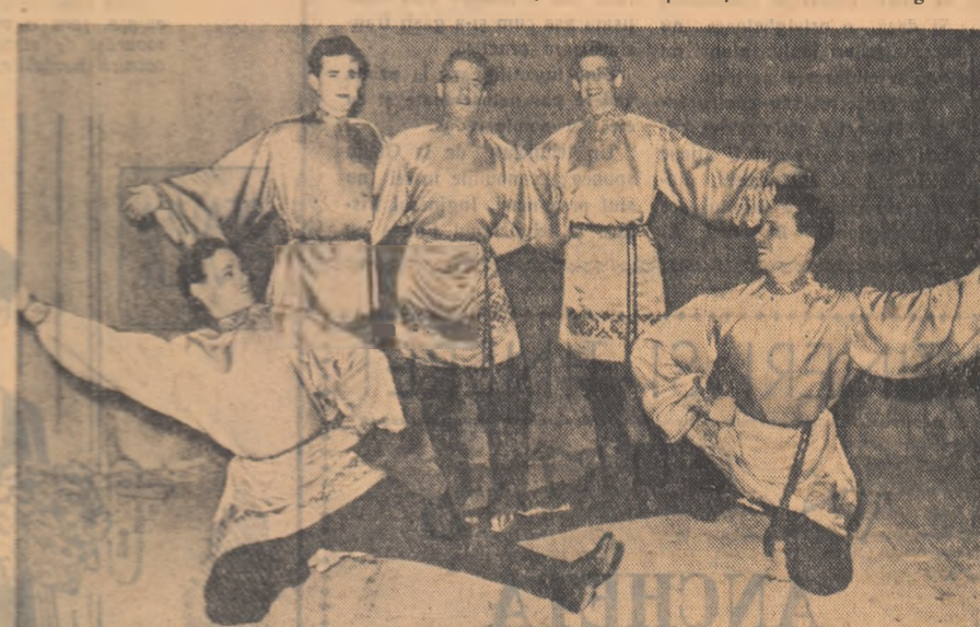
Prima spectacol dat de corul rus din Omsk la Teatrul de Estradă „C. Tănase”

O seamă de importante muzee din Uniunea Sovietică care au primit materiale de la AR.LUS relatează despre folosirea lor, subliniind importanța