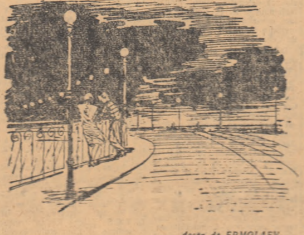
desen de ERMOLAEV