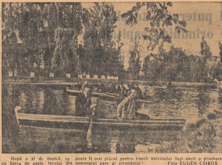
După o zi de muncă, ce poate fi mai plăcut pentru tinerii bătrîniului lași decît o plimbare cu barca pe apele lacului din minunatul parc al ștrandului!