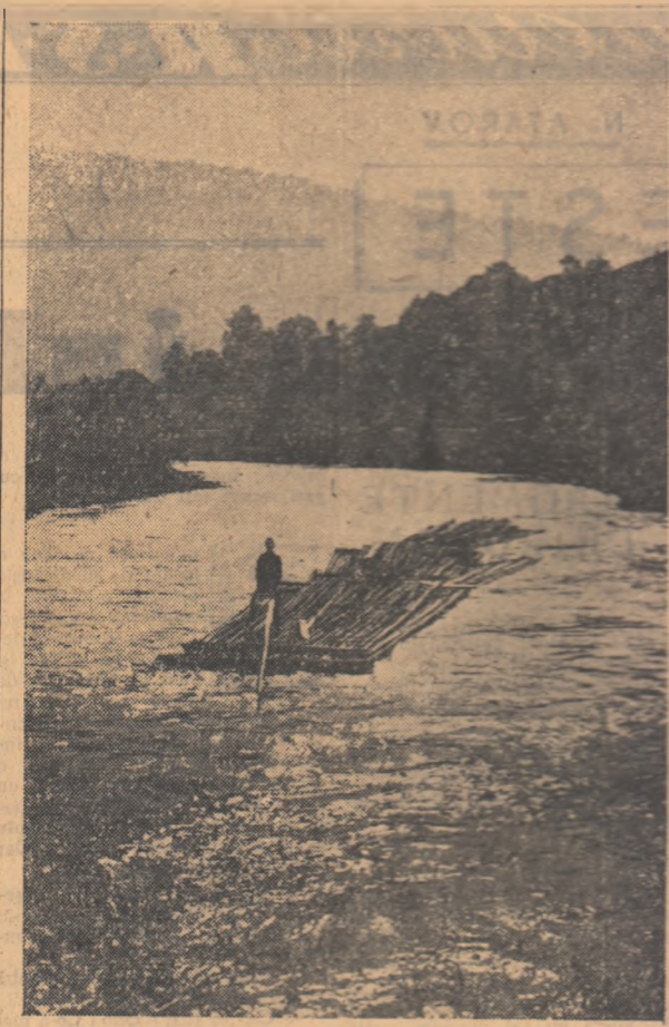
Plutași pe Bistrița.

În raionul Vișeu, de pildă, cei peste 28.000 cetățeni care au participat la 23 adunări populare au hotărât să depună suma de 945.405 lei. Din această sumă se vor executa 38 lucrări noi și 44 reparații.