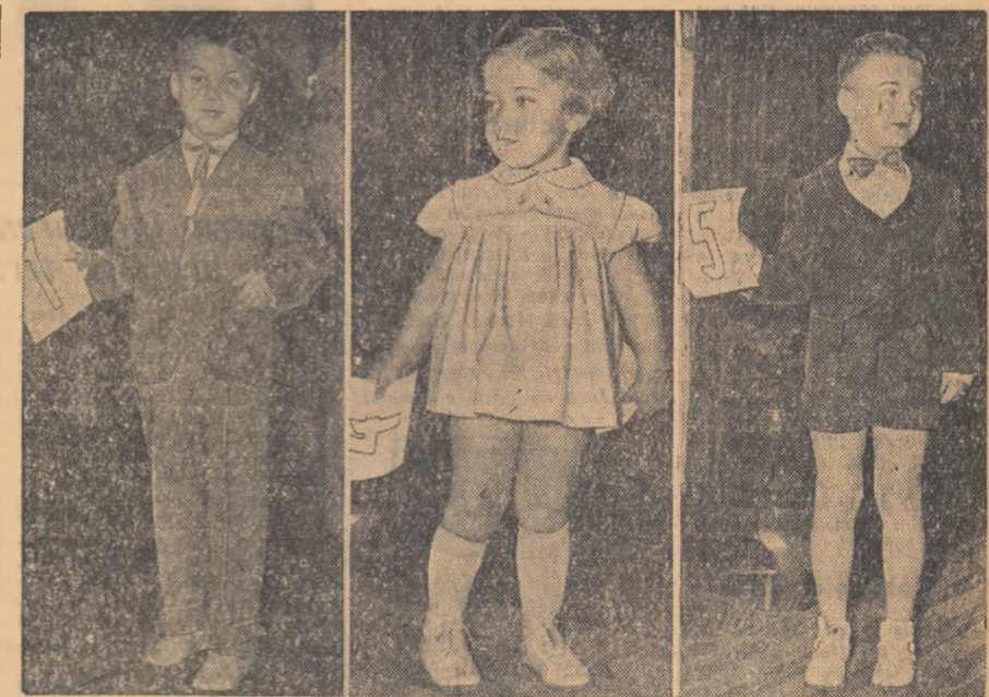
Modele pentru copii realizate de Cooperativa Meșteșugărească și prezentate în cadrul unei parade a modele.