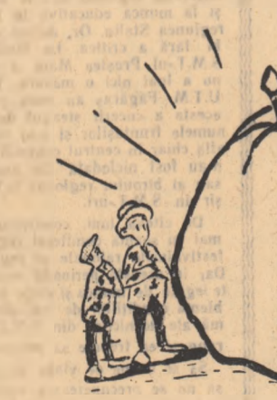
„Măr frumos dar găunos” — cam așa s-ar putea reprezenta efectele nepăsării la S.M.T. Proștea-Mare