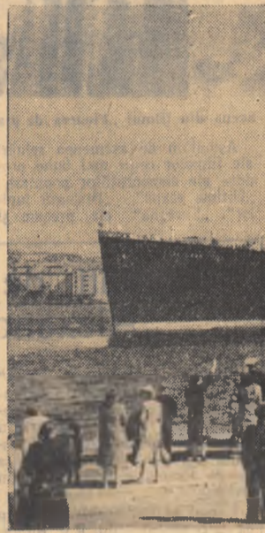
De curînd s-a deschis navigația de vară a vaselor sovietice care fac curse în Orientul îndepărtat. Primul rald pe linia expresă Kamciatka la întreprins Transatlanticul „Uniunea Sovietică”

In fotografie: Transatlanticul „Uniunea Sovietică” pornind în prima sa cursă din anul acesta de la Vladivostok la Petropavlovsk Kamciatka.