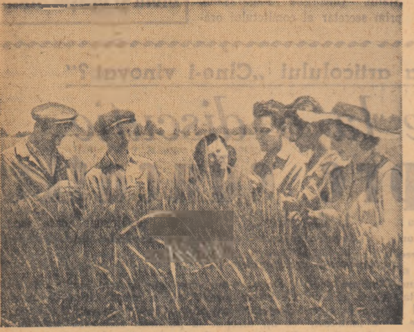
O mare parte din studenții agronomi au și plecat în practică. Iată, în fotografie, un grup de studenți de la Institutul Agronomic „Nicolaie Bălcescu” din București, care au fost repartizați la practică în stațiunea Săftica, încercînd, sub îndrumările asistentului, să determine calitatea viitoareii recolte de grîu.