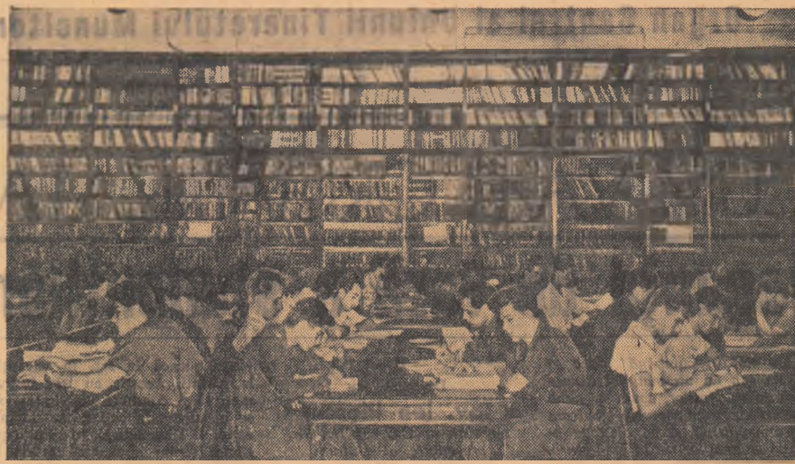
Un aspect obișnuit: studenți pregătindu-se în bibliotecă pentru examenele de sfîrșit de an.