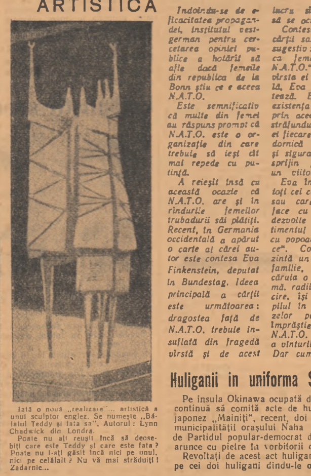
Isia o nouă „realizare” artistică a unui sculptor englez. Se numește „Bătaia Teddy și Londra”. Autorul: Lynn Chadwick din Londra.