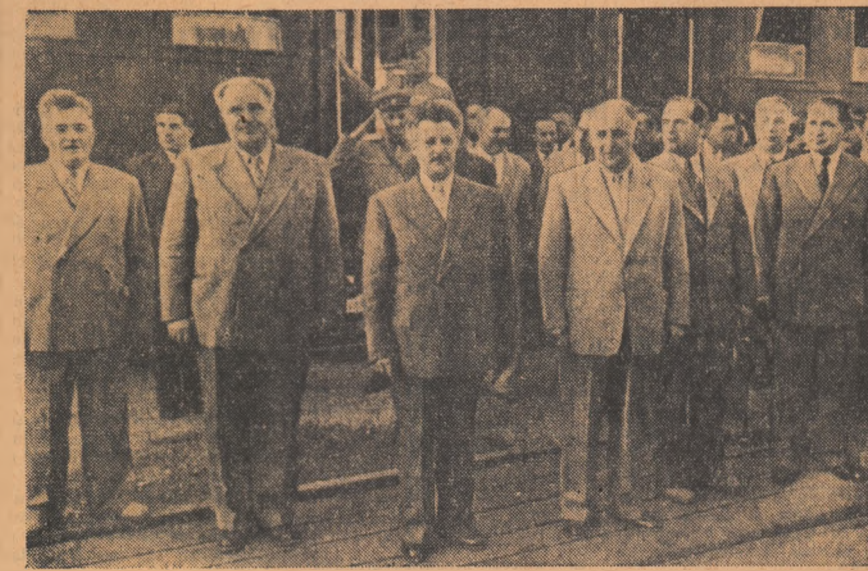
Oaspeții bulgari, pe peronul gării din Cluj

★ Trenul oficial trece prin gările ardelenne în aclamațiile multîmii ★ Colectiviștii oferă daruri ★ Cuvinte de prietenie