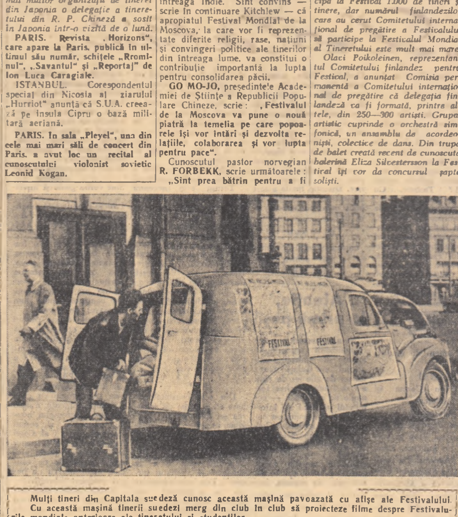
Mulți tineri din Capitala suedează cunosc această mașină pavoazăată cu ațise ale Festivalului. Cu această mașină tinerii suedezi merg din club în club să proiecteze filme despre Festivalurile mondiale anterioare ale tineretului și studenților.

(Urmare din pag. 1-a) rele care funcționează la fabricile și uzinele de aici, toate, sînt puse în funcțiune folosindu-se energia centralelor electrice solare și atomice locale. Orașul din luna nu numai că se autodeservește, dar lucrează ca să spunem așa și pentru export. Aici se produce combustibil sintetic pentru rachetele care se trimit spre pămînt. Există proiecte de construire pe lună a unui mare șantier uzină de nave cosmice. În curînd, vor porni în curse lungi rachete fabricate în secțiile uzinelor din lună. „Deasupra acoperișului transparent al orașului apare un mare nebulosul de fix. Și deodată, alături de el, se fondul cerului negru, se înalță o coloană de foc, dreptă ca o săgeată lansată spre zenit. Aceasta e racheta gigantică care a decolat de pe cosmodrom și a pornit spre Mercur cu prima expediție complexă formată din oameni de știință și de pămînt. Nu! Aluminiul a fost obținut din minereurile locale din lună, și prelucrate la o uzină tot în lună. În fabricile din lună au fost făcute sticle și materiale plastice. Apa din lună obținută din aducerea satelitelor noastre adă plantele ce cresc pe solul din lună. Oxigenul și azotul din aerul orașului sînt de asemenea extrase din mineralele din lună. Lămpile fluorescente care se aprind aici și vor arde toată noaptea, (care durează aproape o lună aici), bateriile care în acest timp vor încălzi orașul, stațiile și cuptoa-