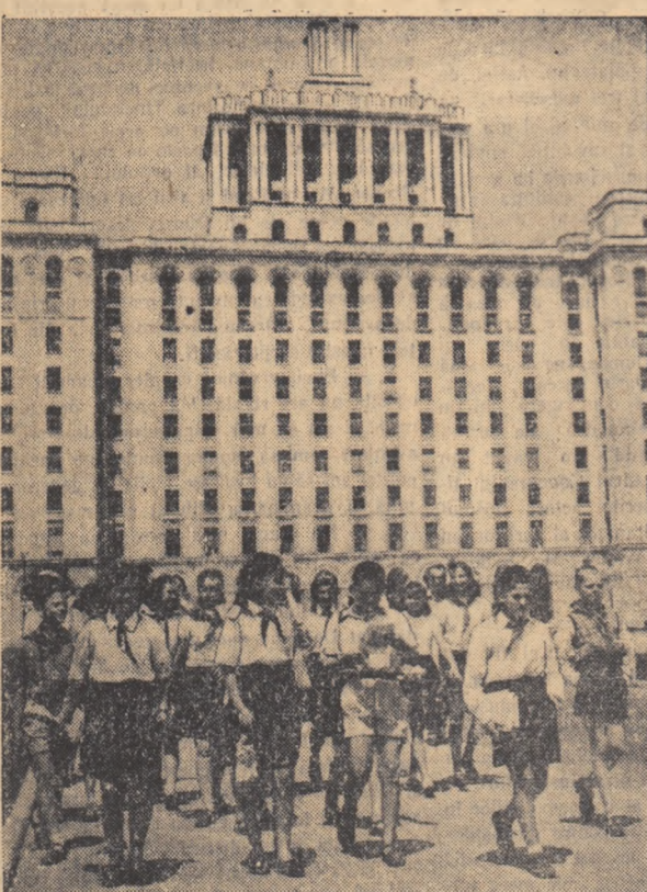
Vizita la Combinatul „Casa Științei” a fost cit se poate de interesantă și instructivă. Cîte nu vor avea de pusești pionierii și școlarii, care au văzut cu acest prilej cum se lucrează un ziar și o carte.