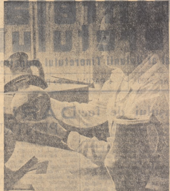
Obiectele găsite în urma săpăturilor sînt cercetate cu atenție. Ele vorbesc despre istoria acestor meștegari...