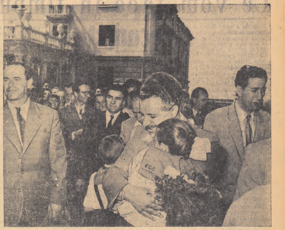
Oaspeții întîmpinați cu căldură la Combinatul chimic „I. V. Stalin” din orașul Victoria.