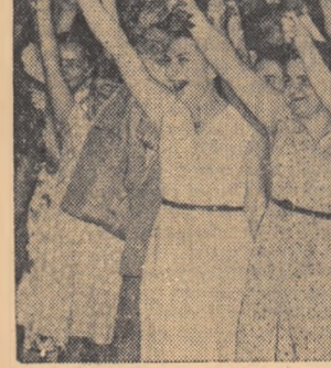
Populația Bucureștilui aclamînd cu entuziasm pe înalții oaspeți