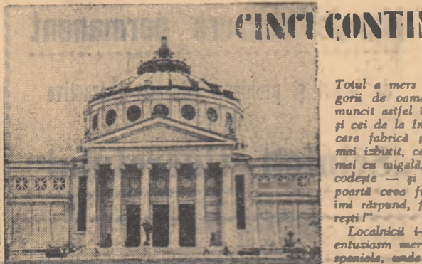
„CINCI CONTINENTE într-un oraș”

Totul a mers bine. Pînă și adesea criticile categorii de oameni, ospătarii și administratorii, s-au nîscut astfel încît au meritat medalia muncii. Pînă și cei de la Industria Ușoră au fost inocenți. Fiecare fabrică și-a adus aminte ca ție ea să facă mai mult, ca să facă mai greu, mai cu oboseală, mai cu migală, și dacă chiar acum o pui să faci se cedește — și a făcut. Întreb și astăzi femei care poartă cîna frumoasă: „De unde ai asta?” Și ele, îmi răspund, firesc: „De la Festivalul... din București”.