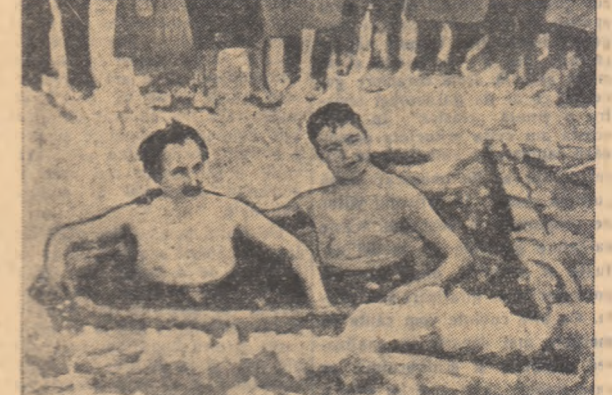
zilele și constituie bala rece. Apoi, înainte de a merge la spital, petrece cîteva clipe la pian, fiind un talentat cîntăreț și pianist amator. Pentru profesia sa continuă să facă băi înghețate și are după cîte se pare numeroși „urmasi”.

ÎN CLISEE: Acum 40 de ani, studentul N. Lujnikov a început să facă băi zilnice în apă înghețată pentru a se vindeca de tuberculoză.