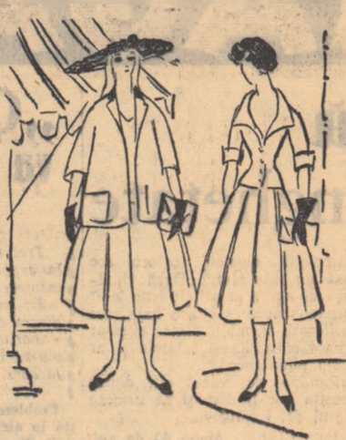
Port de necesități nu numai între diferitele părți ale îmbrăcămintei noastre, dar în însăși construcția acestor haine. Acest adevăr este rareori înțeleș și de multe ori se întrebă de ce este urîtă o anumită rochie, negîndî că a fost concepută luîndu-se după bunul plac, gîndul unui model, fustă alta și în fine, făcîndu-se unele „mici” modificări la corajul modelului inițial.

Rochia strimbată are de asemenea legile ei, cere anumite raporturi de linie și formă. Pentru ca trupul să nu apară plăt din pricina fustei foarte strimbat, se accentuează puțin, prin cîte solduri, iar talia se accentuează de obicei printr-un cordon mai lat care susține corajul ce se cere a fi puțin bluzat. Acest coraj bluzat, la rîndul lui, interesează deosebit mai larg, care nu ar sta fix din pricina lîngăimii corajului, așa că se recurge la singurul decolteu ca va putea sta fix, anume la decolteul mai larg, pe umeri. Și bineînțeles, un asemenea decolteu cere neapărat mică o mină scurtă în complexarea umărului pe jumătate dezgolit, dar locul unde se încheie minca fiind foarte redus, din aceeași pricină, se preferă minca chimono, adică minca tăiată dintr-o bucată cu corajul. Vedeti dar că există o logică strîmă, așa spune un ra-