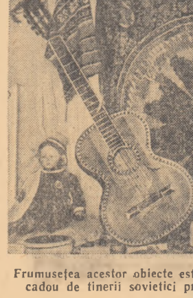
Frumusețea acestor obiecte este de neasemuit. Ele vor fi oferite cadou de tinerii sovietici prietenilor lor veniți la Festival.

În luna septembrie 1956 restricțiile au fost înaprinite și mai mult, cerîndu-se rapoarte detaliate, un adevărat jurnal despre desfășurarea expedițiilor, iar fiecare fotografie trebuie prezentată unui oficiu guvernamental. În afară de toate acestea, s-au majorat și taxele, astfel încît o excursie pe Everest s-a scumpit grozav. Ascensiunea pe un pic, într-o 7.500 de metri și 8.000 de metri costă 440 de dolari, iar de