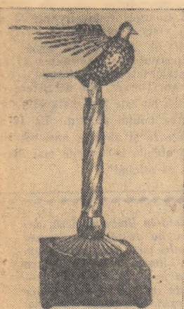
Unul din darurile pe care tinerii sovietici le-au pregătit pentru oaspeții lor la Festival.