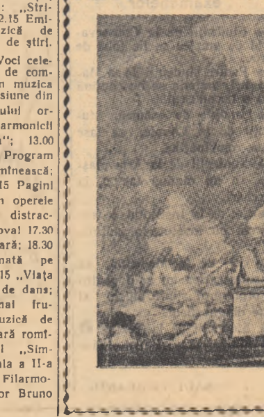
Pagoda păcii lumii din Rangoon

În țărîndurile trei zile: Vreme la început relativ răcoasă și favorabilă avertiselor de ploaie cu caracter parțial în jumătatea de răsărit a țării. Pe alocuri grindină slabă. Cer senin noaptea și dimineața. Vînt slab pînă la potrivit din sectorul estic. Temperatura staționară la început apoi în creștere. Minimele vor oscila între 5—15 grade iar maximele între 12—29 grade.