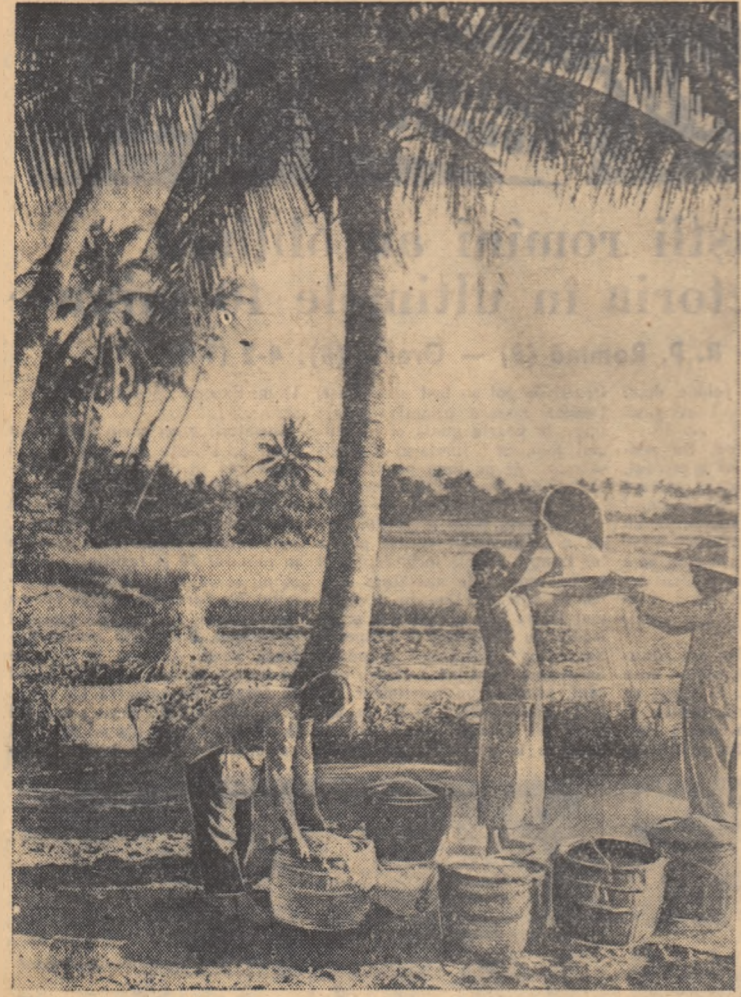
Insula Hainan din sudul R. P. Chineze a doua ca mărime după insula Taiwan. În această insulă ploile sînt abundente și datorită acestor ploaie locuitorii obțin trel recolte de orez pe an. În foto: Membrii cooperativelor agricole din Wan-ning, de pe insula Hainan, stringînd prima lor recoltă de orez din acest an.