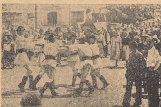
Dacă în dimineața aceea puteai sta cocoțat undeva, deasupra orașului, ai fi văzut un lucru de-a dreptul uimitor. Uimitor prin mărime și simetrie. Izvorind parca din orizont, dinpre fiecare punct