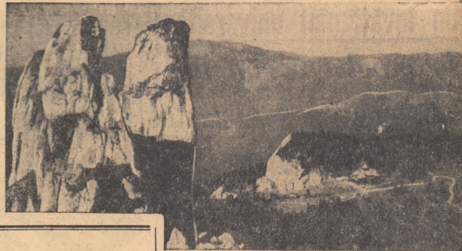
Pietrele Doamnei. In fund se vede Cabana Rarău

In pag. 3-a Continuarea romanului foleton „Robinsonii cosmici“ In pag. 4-a Concursul de jocuri