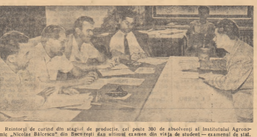
Reîntorși de curind din stagiul de producție, cei peste 900 de absolvenți ai Institutului Agronomic „Nicolae Bălcescu” din București dau ultimul examen din viața de student — examenul de stat.