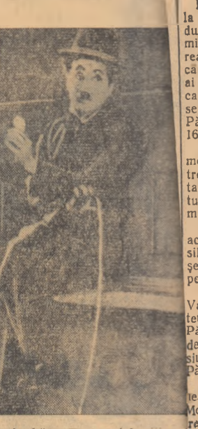
de barbă pe impozantul milionar Chaplin a înțeles că este estetic și se provoacă risul care este numai la adresa celor care sînt nesc în capitalism, a celor „păzoanți” și că risul „înțeles” față de eroul său omulețul caragios și un rîs condescendent de încurajare.

S-a remarcat adesea rotul deosebit acordat obiectelor nelensu-șibile în modalitatea comicului chaplinian. În prezența lui Charlot obiectele se revolvă, fac alt-ceva decît trebuie: mătura poc-nește peste cap, ușa lovește în nas, farfurile zboară din mîni, ștergutele devin macarone gustoare pline de mîdău etc. etc. Charlot este un fel de uenic erou dominat de obiecte pe care nu le-a auzit, dar pe care ar trebui să le știți, care ar trebui să-l servesc cu ascultare. Faptul că obiectele îndeplinesc rolul de cîră ce le-a fost destinat sugerează ideea că ceva „nu este în regulă”, că la baza lumii în care se zburicium Charlot ceva nu este la locul său, nu este bine arîndit, ar trebui schimbat ceva. Departe de noi intenția de a face din Chaplin un revoluționar, dar este lîmpede că el a înțeles, în general, prin instinct artistic, cine este vinovat de proasta orînduire din societatea burgheză, de cine trebuie să se ridice în ultimă instanță și cine trebuie înțeles condamnat atunci cînd pînăntile eroului său provoacă amuzament, lată cum și-a definit el printre altele omul: „Inchiziții-va un capitalist îngîmfat, care nu-și mai încapă în piele, cu o barbă impunătoare, cu pantaloni dungați, redingotă, ghete, cilindru — mă rog, toate atributele unui milionar. Pînă și celui mai pașnic om dintre noi, nu se poate să nu-și fi venit mîdă de a-l trage de barbă, așa din senin. De aceea nu-și de mirare că publicul ride, încîntat, cînd un omuleț caragios ca mine îl ia