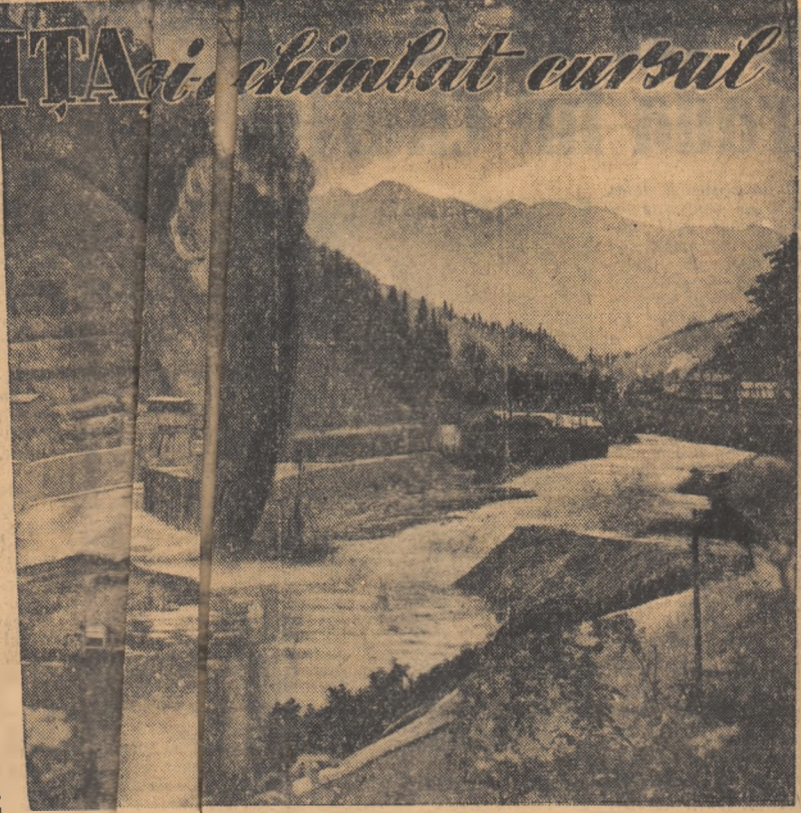
această Bistrița și-a schimbat cursul pe canalul de beton din stînga

acum. Alți constructori au și acele cifre și tehnice. Așază sint aproape defecte, inciu se bucură uctul muncii culorea l