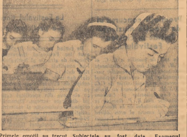
Primele emoții au trecut. Subiectele au fost date. Examenul scris la limba romînă a început.