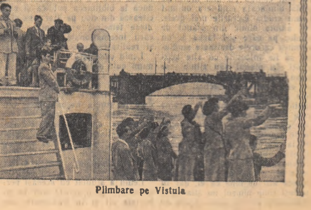
Pilmbare pe Vistula