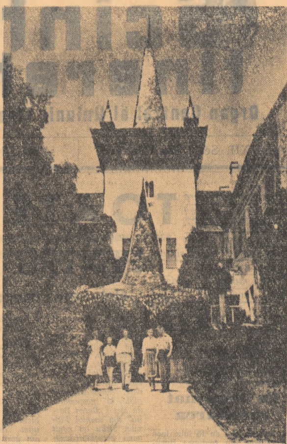
Muzeul Sculesc de la Sfintul Gheorghe — Regiunea Auto-nomă Maghiară.