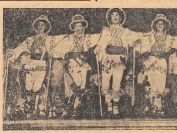
Ansamblul de dansuri „Doina” repetă pentru spectacolele ce le va da la Moscova în cadrul celui de-al VI-lea Festival Mondial al Tineretului și Studenților.