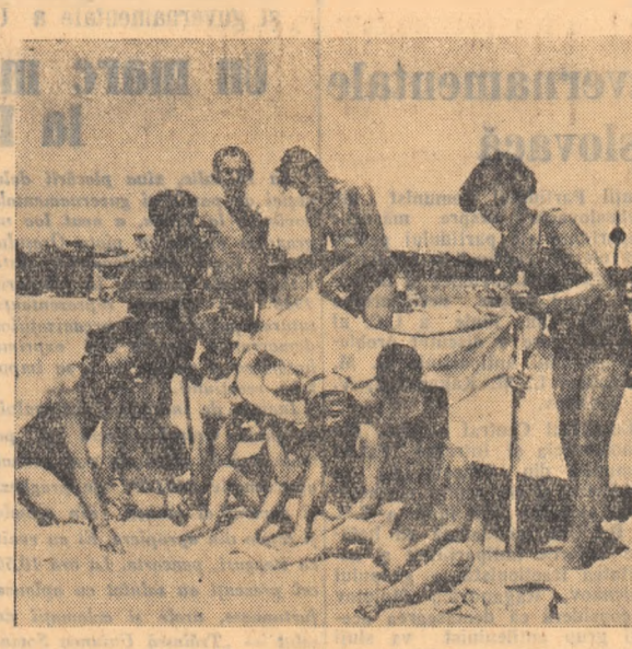
O imagine obișnuită din tabăra pentru copii de la Eforie