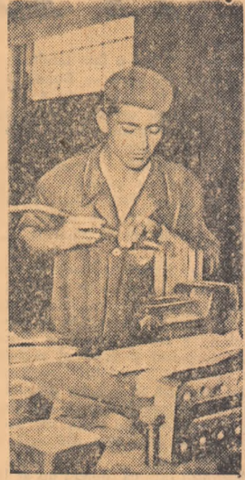
Tinerii de la uzinele „Mao Tze-tung” din Capitală au ales ca delegat pentru a participa la cel de-al VI-lea Festival Mondial al Tineretului și Studenților de la Moscova...