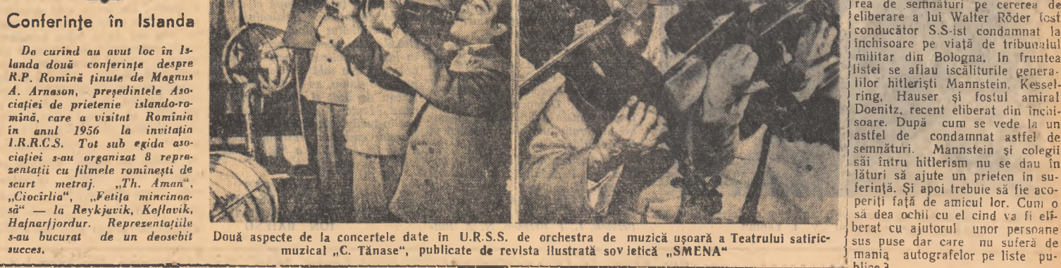
Doi aspecte de la concertele date în U.R.S.S. de orchestra de muzică ușoară a Teatrului satirico-muzical „C. Tănase”, publicate de revista ilustrată sovietică „SMENA”