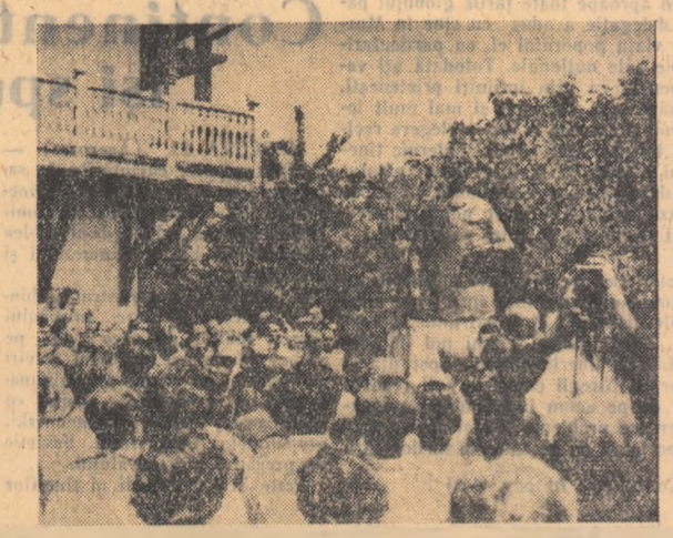
Un aspect de la festivitatea deschisă în curtea casei memoriale a 50 de ani de la moartea pictorului.