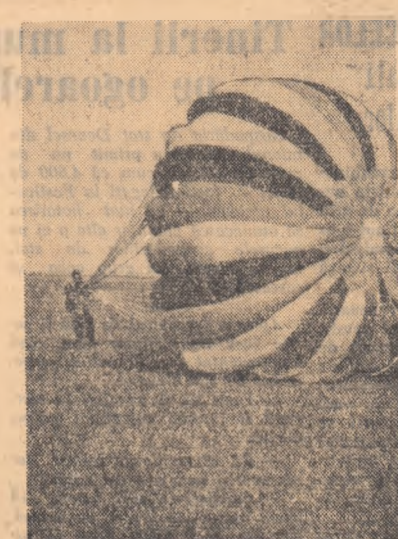
O aterizare la „punct fix”

Cine a luat parte săptămîna trecută la campionatul republican de parașutism a simțit de multe ori că — și se auză parul în virful capului”. Așa s-a întîmplat, de exemplu, la proba de lansare combinată de la 1.500 m înălțime. Șuși ce înseamnă asta? Concurtenții se urcau cu avionul la un kilometru și jumătate de-așupra aerodromului. Cînd a ajuns la verticala reperului și, după ce a făcut rapid toate corecțiile necesare, se lansează în gol. Legea gravitației îl cheamă spre pămînt cu o viteză de bolid și un spectator neîmțit își acopera fața cu mințile, crezînd că în curînd va urma un spectacol îngrozitor. Parașutistul spîntecă, într-adevăr, spațiul cu o viteză uimitoare fără a deschide parașuta, nu pentru- că i s-ar fi întîmplat ceva, ci pentru- că are regulamentul. Cu un calu aproape de neînchis, care nu se poate cîti decît prin lunetele „Buschi” ale arbitrilor instalați la cîteva kilometri pe marginea aerodromului, el calatorește prin aer, în poziția orizontală, cu mințile și picioarele desăluțe în stilul „broasca” și, din cînd în cînd, privește atent cîndrîrul cronometrelor, instalat pe sacul parașutei de abdomen. Cînd unul din cronometristi a ajuns în dreptul cîrrei 20, semn că timpul de cadere liberă a surs, parașutistul acționează siguranta și de-așupra lui se holtește o cupolă multicoloră, care face să se audă pînă jos, cu o înfrîiere de cîteva fracțiuni de secundă, un zgomot