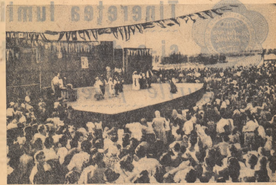
În parcul „8 Mai” din raionul I. Mai, a avut loc serbarea în aer liber, dată de diferite formații de artiști amatori, în cinstea Festivalului de la Moscova. Aspect din timpul serbării.

Insoțit cu gândul marile demonstrații ale tineretii și ale prietenilor de la Moscova, tineretul din București a făcut să răsune și în orașul său cîntecul, dansul și voia bună, pentru pace și prietenie, pentru tinerețe.