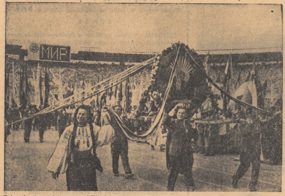
Delegația tineretului nostru, delîind la festivitatea de deschidere a celui de-al VI-lea Festival