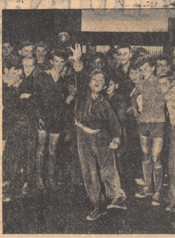
Cercul aruncătorilor, briul sîngeru ovaloid al pistol de alergări vor avea întotdeauna adepți credincioși...