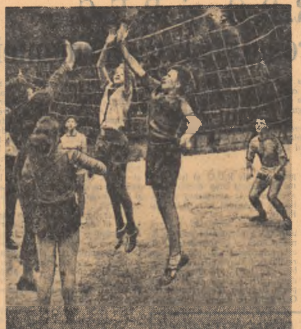
Și în acest an prin grija F.I.A.P. copiii din Franța, Italia și alte țări își petrec concediul în tabăra de la Sinaia. Foto-reporterul a surprins un moment interesant dintr-o disputată partidă de volei.