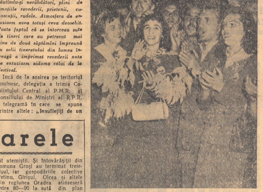
Aspect de la sosirea delegației