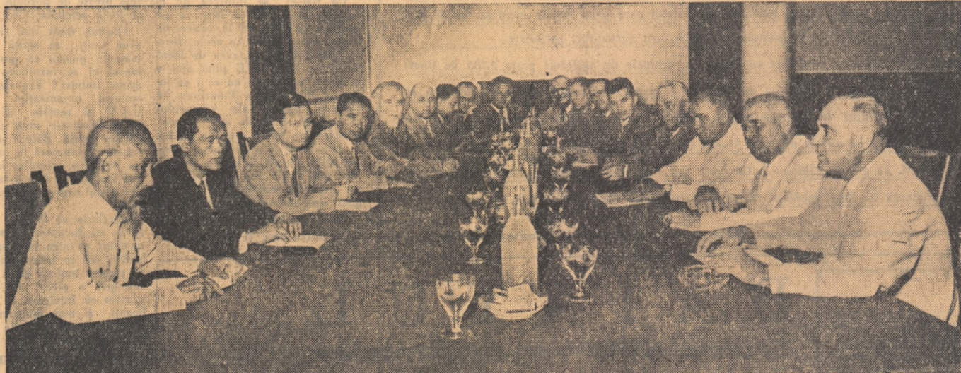
Aspect de la vizita tovarășului Ho Și Min la Comitetul Central al Partidului Muncitoresc Român