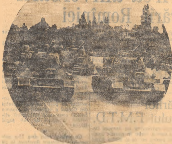
Coloșii de oțel trec prin piață