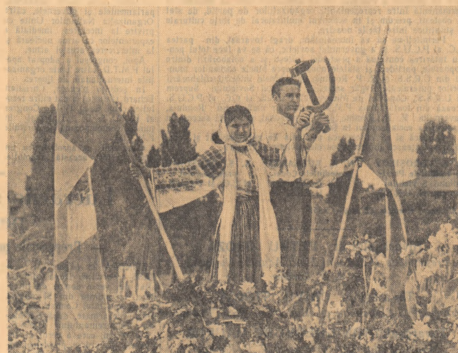
Cei ce minulesc seceră și ciocanul sînt pentru totdeauna înfrății! (Carul alegoric purtat de tineri țărani muncitori din regiunea București)