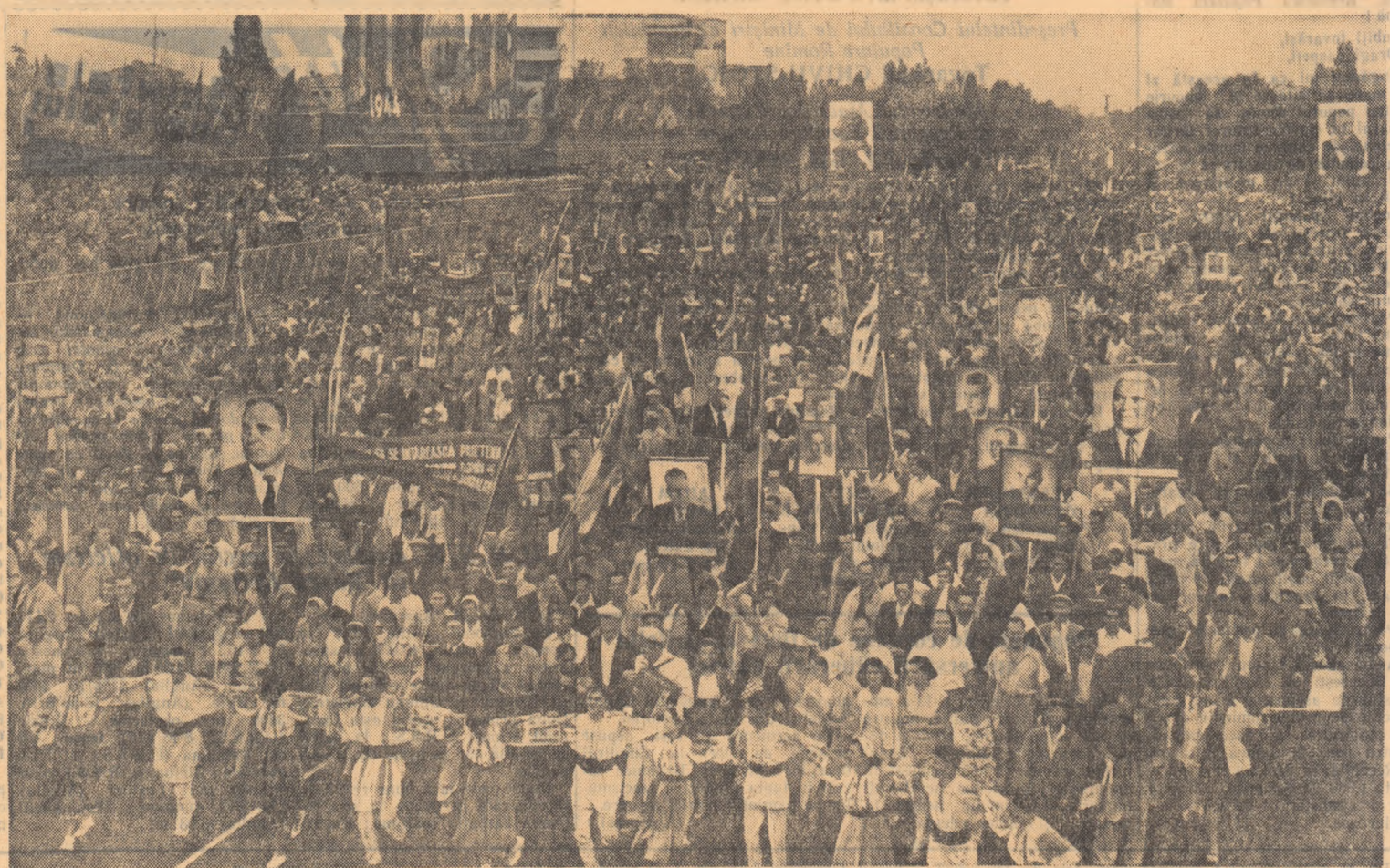
Cîntec, joc, veselie — poporul mînlăstează