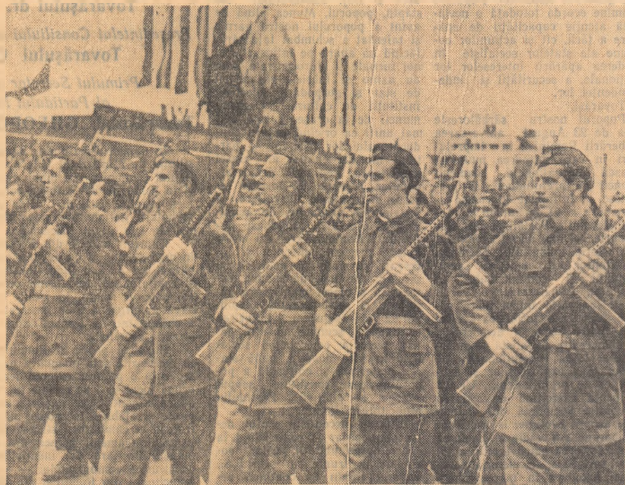
Cu 13 ani în urmă — apărau Bucureștii. Astăzi construiesc o viață nouă, socialistă, pe care sînt gata oricînd s-o apere.

E ziua ta, patrie! Te salută inovatorii, raționalizatorii, fruntașii, toți acei ce contribuie la crearea și dezvoltarea industriei, spre binele poporului muncitor. L. POPESCU