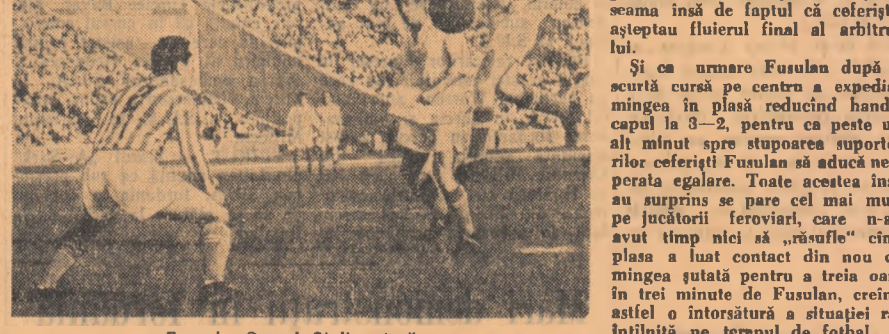
Energia Orașul Stalin atacă...