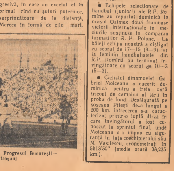
Fază din meciul de fotbal Progresul București—Minerul Petroșani