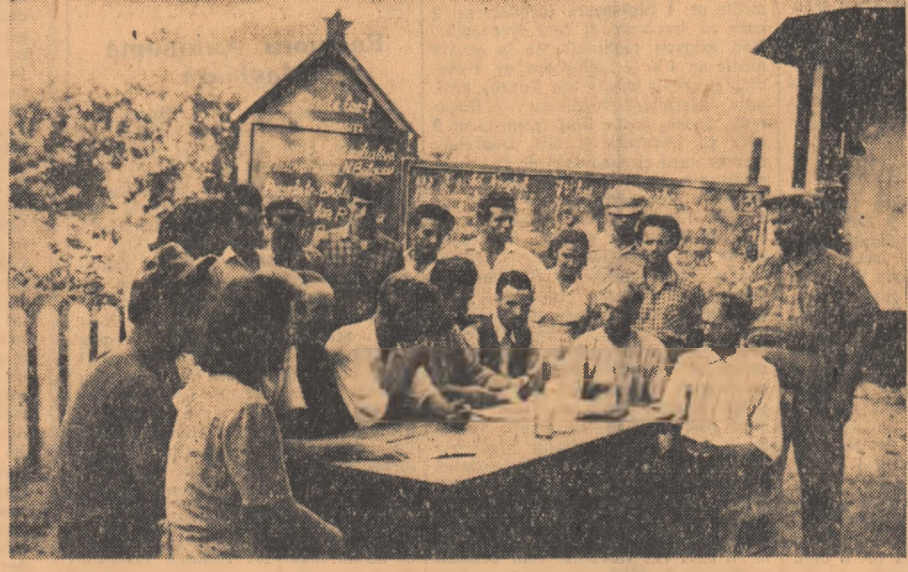
O parte din întovărășii din comuna Grivița în sfat: treburile noi familii în care au intrat, cer mullă răspundere și chibzuință!