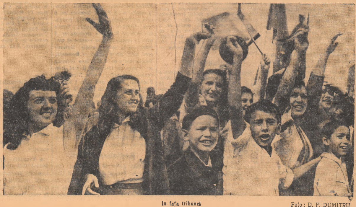
În fața tribunului