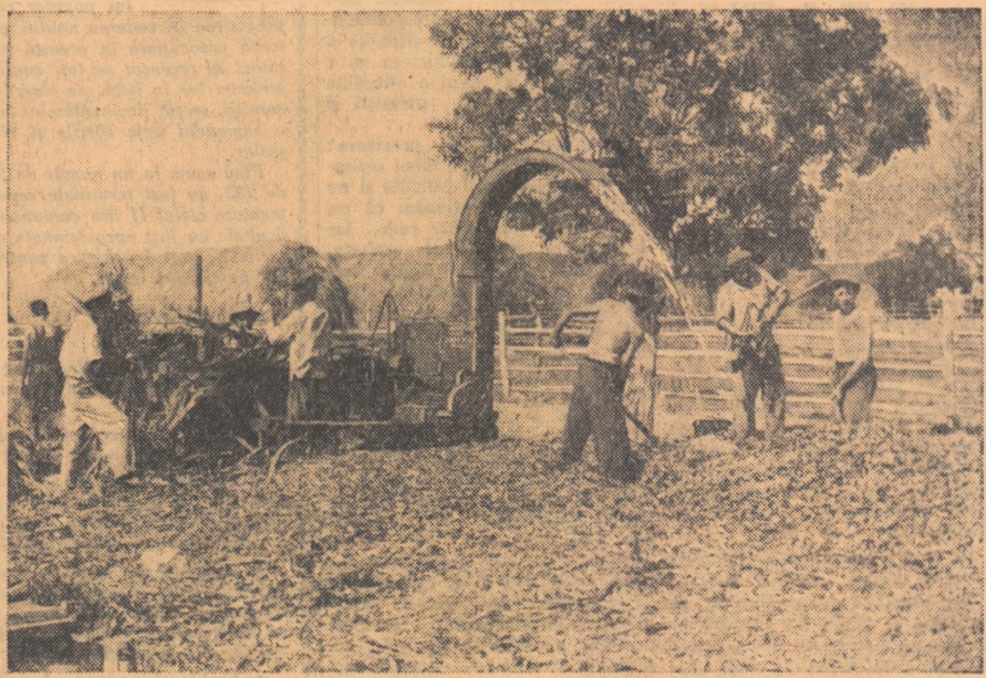
Însolozarea porumbului furajer la G.A.C. „Olga Bancil” din com. Palazu-Mare (reg. Constanța). În acest an colectiviiștii au însolozat pentru sectorul zootehnic al gospodăriei 26 vagoane porumb furajer. La însolozare lucrează echipa de colectiviiști condusă de Gheorghe Pătrașcu.