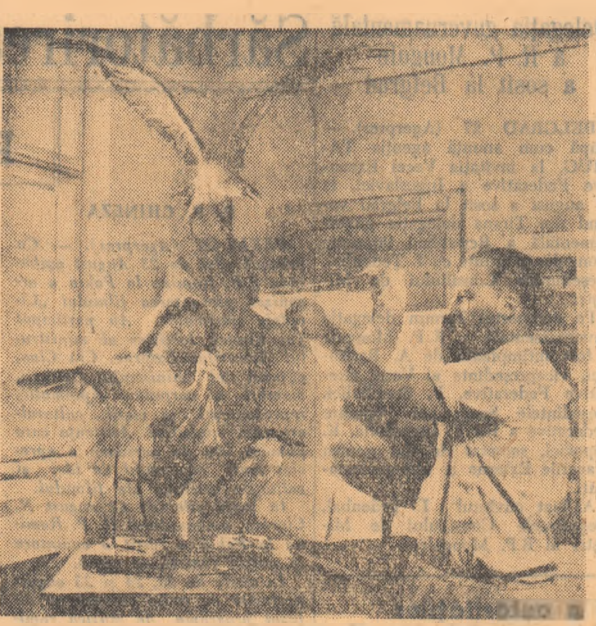
În acest an, colectivul atelierelor de materiale didactice din Capitală...