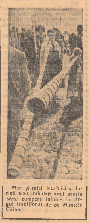
Mari și mici, localnici și turiști s-au îmbulzit astăzi în jurul tradițional de pe Muntele Găina.

Indur credem că sîntim din plin, ei înșiși, răspunderea, cetățenescă îndatoritoare ce le revine de a face — prin munca lor — ce acestă instituție culturală și-și îndeplinească menirea pentru care a fost creată — aceea de a contribui nemijlocit la educarea oamenilor muncii aparținînd minorităților naționale din Constanța.