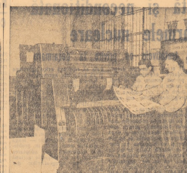
In toamna aceasta, întreprinderea poligrafică nr. 1 din Capitală va executa pentru noul an școlar 1.820.300 exemplare de diferite manuale școlare tipărite în 16 limbi ale naționalităților conlocuitoare din R.P.R.

Președintele Prezidiului Marii Adunări Naționale a Republicii Populare Romine