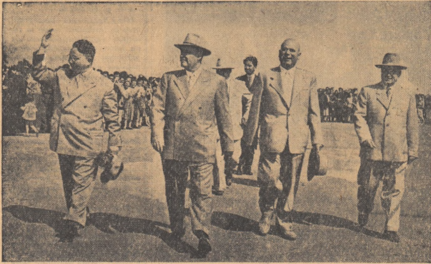
La soirea, pe aeroport