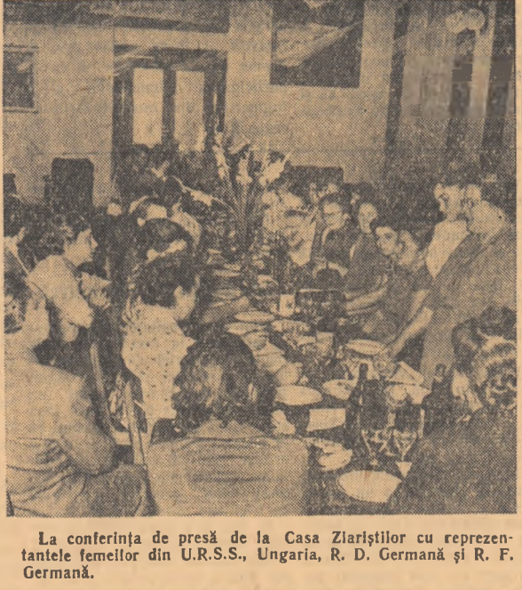
La conferința de presă de la Casa Ziaristilor cu reprezentantele femeilor din U.R.S.S., Ungaria, R. D. Germană și R. F. Germană.