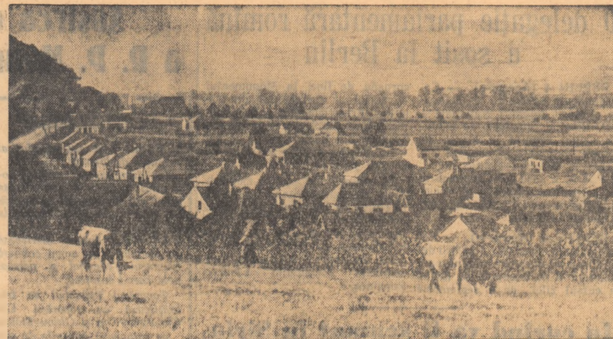
Între o vedere a unui nou cartier de la marginea Devel. În ultimii ani s-au construit aci aproape 50 de case ale muncitorilor și țărănilor muncitori care au primit credite de la stat.