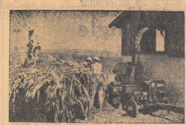
Gospodăria colectivă din Codlea, regiunea Stalin, are un sector zootehnic puternic, bine dezvoltat. Pentru a asigura hrana necesară animalelor pe timpul iernii, la această gospodărie se înalozăază, în această toamnă, peste 50 vagoane porumb furajier.

In fotografie: un aspect de la înalozarea porumbului.