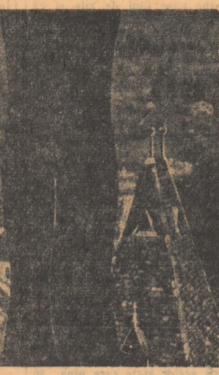
Sighișoara văzută din turnul castelului.

Gazul metan identificat în noul bazin este pur: analizele arată o compoziție de 98,4 la sută metan, 0,85 la sută etan și 0,85 la sută propan. Descoperirea noilor zăcămint de gaz metan deschide mari perspective de dezvoltare a orașului Craiova.