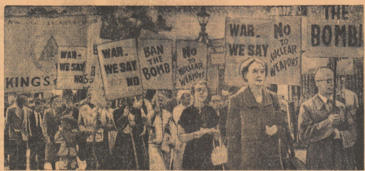
În Anglia, mișcarea împotriva armelor de exterminare în masă la o amploare tot mai mare. În fotografie: o demonstrație de masă în Hyde Park. Multimea poartă placarde pe care se poate citi: „Războiului îi spunem nu!”, „Interziceți bomba!”, „Nu armelor nucleare!”.

Puterile occidentale s-au pronunțat împotriva rezolvării independente a problemelor privind încetarea experiențelor cu arme atomice și cu hidrogen.