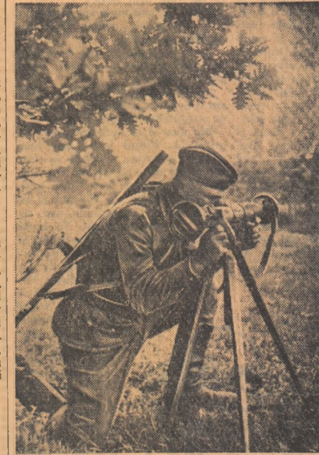
Prin igliul constiințios cum execută măsurătoarea distanțelor, telemetriștii contribuie din plin la buna reușită a tragerilor.