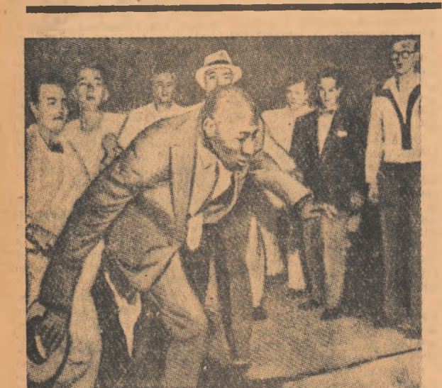
Una din victimele terorii rasiste din S.U.A. — un pastor negru brutalizat în fața școlii din Little Rock

Pentru a comemora tradiționala „Legendă despre zilele de la Tarnowskie Gory” care se sărbătorește anul acesta în Tarnowskie Gory din voievodatul Katowice (Polonia), a fost deschisă recent publicului o mină de plumb și zinc. Labirintul de 150 km. de galerii și drumuri subterane ale vechii mine Tarnowskie-Gory se întinde sub oraș și sub suburbiile acestuia. Accesul este la vechii galerii, care a fost deschisă pentru public, permite vizitatorilor să cunoască metodele și condițiile de muncă, precum și uneltele folosite de mineri de-a lungul secolelor.