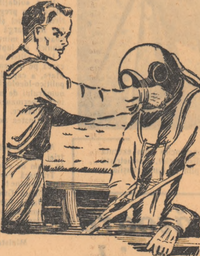
Desen de A. CALISTRAT

Se prinse de parma elicei. Mi-na înghețată îi alunecă. Scăpă parma ajutătoare și căzu greu la fund. În câteva minute, ce vor spune cel din barcă? Auzi, un scafandru care își pierde cleștele... Și doar ar fi terminat lucrul în câteva minute! Se forță să atingă mîna la fund. Își aminti de maestrul său care își aruncă inelul în apă și apoi îl scoate cu ușurință. Totul e să nu strănăști mîna, să nu tulburi apa... Căși fără greutate cleștele și trase de trei ori de