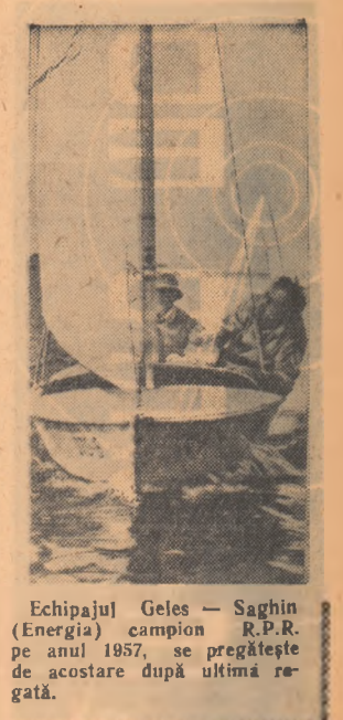
Echipajul Geles — Saghin (Energia) campion R.P.R. pe anul 1957, se pregătește de acostare după ultima regată.

Manifestarea timpurie a unei aptitudini este desigur semnul distinctiv al unor predispoziții favorabile dezvoltării ei. Așa de pildă, Mozart și Haydn manifestau aptitudinile muzicale de la vîrsta de 2—3 ani, iar Rimski Korsakov de la 4 ani. La 5 ani Mozart compune un menuet. La aceeași vîrstă George Enescu creează compoziția „Pămîntul românesc“. Pictorii ruși Repin și Surikov manifestă aptitudinile pentru desen încă de la vîrsta de 8—4 ani, iar Gloek Van Dyck și Raffael realizează lucrări valoroase la 8—10 ani. Desigur că nici aceștia n-ar fi ajuns la dezvoltarea aptitudinilor lor, fără un proces cel de elementar de învățătură. El au trebuit să învețe să deseneze, să compună. În unele cazuri, mediul familial, activitatea părinților, au