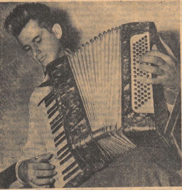
In clipela de odihnă puțină muzică nu strică