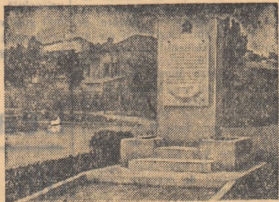
Monumentul, ridicat în memoria muncitorilor gălățeni, ucizi mișcările de glorioasă burghezo-moșierimii la 13 iunie 1916

Inițiativa tinerilor din Vladimiri a avut un puternic ecou în rândurile tineretului din întreaga țară