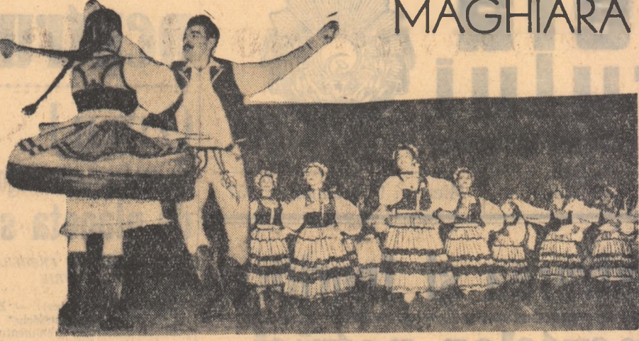
Dansul miresei, executat de ansamblul secucies de stat din Tg. Mureș