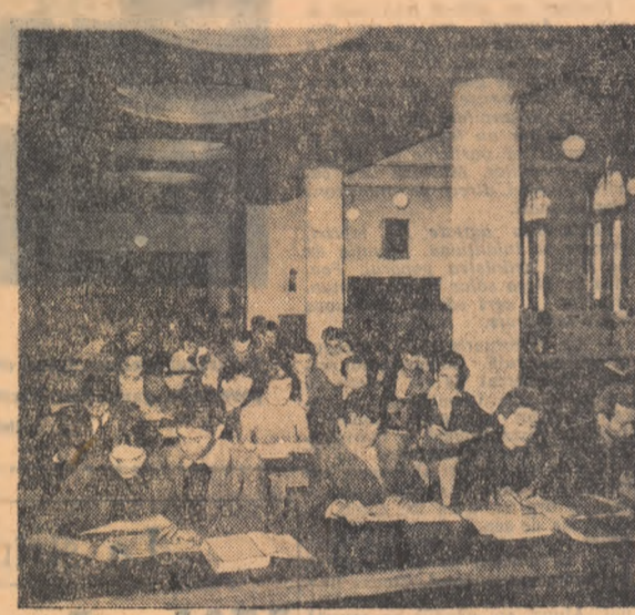
Una câte una cărțile ar încep să fie scoase din dulapurile bibliotecilor, fișerile au început să fie consultate de zeci de ochi...