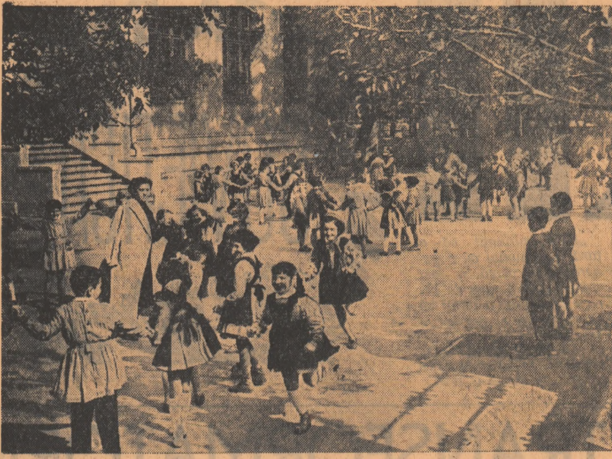
La Școala mixtă de 7 ani nr. 11 din Capitală copiii se bucură din plin de minutele de recreație.

Tineri și tinere, Participați în număr cât mai mare la CONCURSUL pentru corespondenții voluntari organizat de ziarul „ȘCINTEIA TINERETULUI”