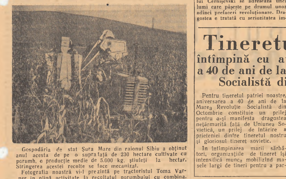
Gospodăria de stat Șura Mare din raionul Sibiu a obținut anul acesta de pe o suprafață de 230 hectare cultivate cu porumb, o producție medie de 5.000 kg. știelele la hectar.

Pină la ziua aniversării Marii Revoluții din Octombrie mai sînt doar puține zile. La Complexul Grivița Roșie pregătirile în vederea intîmpinării acestei sărbători sînt în toi.