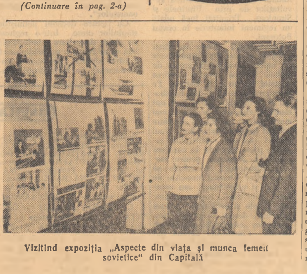
Vizitînd expoziția „Aspecte din viața și munca femeii sovietice” din Capitală