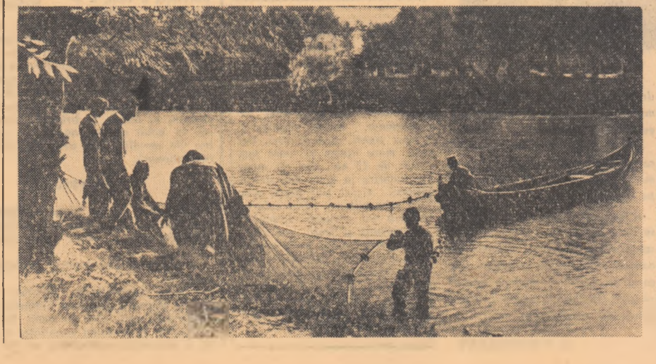
In bălțile G.A.S. din comuna Minăstirea, Scoiceni, Buldu și Marotiu se pescuiește zilnic aproximativ 500 kg. pește. Aceste cantități sînt trimise la unitățile alimentare din Capitală.

R.D. Germană, R. Cehoslovacă și R.P. Poionă. Instrumente muzicale, aparate fotografice și hirtie fotografică din R.D. Germană, ceasornice de mină din U.R.S.S., articole de sport din R. Cehoslovacă, aparate de ras din Suedia și lame de ras din Israel și R. Cehoslovacă, stilouri din R.D. Germană și altele bunuri de larg consum contractate în diverse țări. S-au achiziționat de asemenea autoturisme din R. Cehoslovacă și U.R.S.S., motocicletă simplă din R.P. Ungară, biciclete pentru femei și copii din R. Cehoslovacă și U.R.S.S., precum și piese de rezervă pentru motocicletă și biciclete. În curînd vor sosi noi mărfuri de larg consum industriale printre care se numără mătase, jesături din lînă și haine de piele importate din R.P. China, sticle din R. Cehoslovacă și R.P. Poionă, încălțăminte din R. Cehoslovacă și R.P. Bulgaria precum și alte mărfuri. (Agerpres)