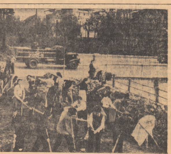
Studenți bucureșteni la muncă voluntară pe șantierul din Splaiul Independenței.

Trompetele au răsunat prelung, apoi în acordurile marșului întonat de fanfară apar în pas viu stegarii urmași de sirurile sportive din Uniunea Asociațiilor studenților din Orașul Stalin.