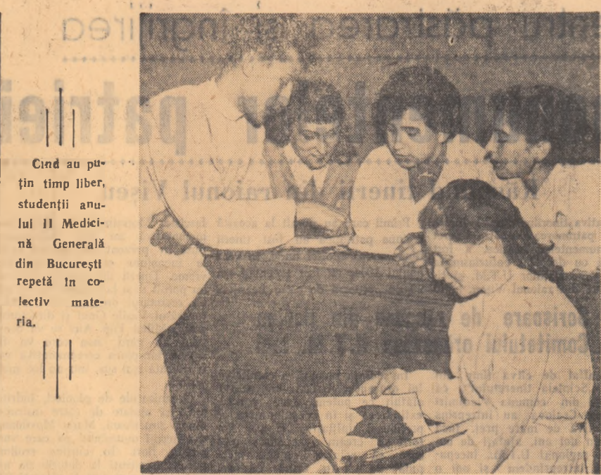
Cînd au puțin timp liber, studenții anului II Medicină Generală din București repetă în colectiv matematica.